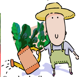
Ganador de rábanos Franceses: 'Mejor restaurant Italiano'; Boulder, CO

• Cuando preparado con oxígeno de la bomba de aire, esta Infusión actúa como un catalizador agente, enlazando Los huecos críticos entre la tierra, nutrientes y planta.