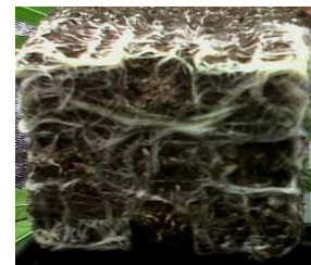
Pepinos perfectos Boogie ... ..de las mejores Boogie-raíces